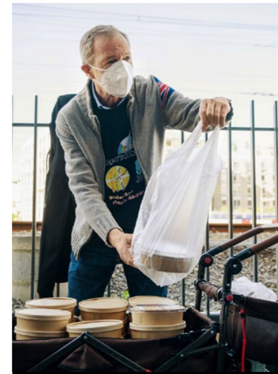
«Was möchtest du? Chili con Carne, Pasta oder Reis?»

Wobei ich beichten muss, dass ein Kollege und ich einem Mann mit zitternden Hosenstössen hundert Meter weit nach vorne zogen. Vor vier Jungs. Der alte Mann hätte sich zwei Stunden