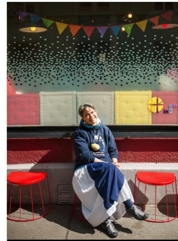
«Wir würden es in ihrer Lage ebenso tun.»

Einmal kam ein Zürcher Stadtrat vorbei. Er hatte die Warteschlange vom Zug aus gesehen und fragte: «Gibt das einen Sog-Effekt?» Da es mein erster Einsatz war, konnte ich das nicht beantworten. Kaum war er weg, fragte jemand: «Ich habe gehört, hier gebe es gratis Essen.» - «Stimmt», sagte ich. «Kann ich drei Portionen bekommen? Für meinen Sohn, für mich und meine Tochter?» Klar doch.