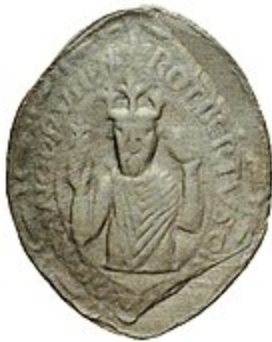
Siegel Roberts des Frommen

Frankenherrschers nach der Schlacht von Zülpich (496) in Zusammenhang gebracht. Auch ließ man Königin Chrodechild die Lilien in Empfang nehmen, um sie diese ihrem Ehemann überreichen zu lassen, womit ihr herausragender Einfluss auf die Konversion Chlodwigs zum katholischen Glauben hervorgehoben wird (siehe die Darstellung im Stundenbuch des Bedford-Meisters; zum Motiv vgl. auch die Verkündigung des Herrn). Im Selbstverständnis des kapetingischen Königtums des hohen Mittelalters unterstützte die Lilie als unverkennbares äußerliches Symbol seinen Anspruch, die königliche Autorität unmittelbar von Gott erhalten zu haben, ohne dazu eine Vermittlung seitens des Papstes oder des Kaisers notwendig gehabt zu haben.